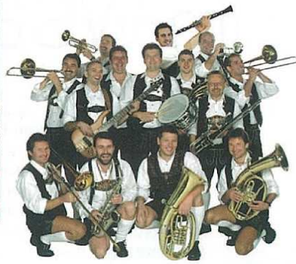
original bayrische Showkapelle

eine, die an diesem Event teilnehmen möchten, sind noch bis Ende Februar gute Karten reserviert!